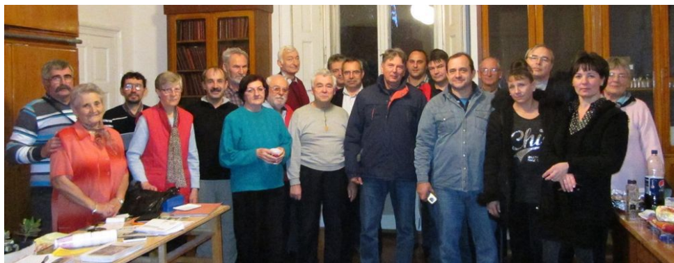
Csoportkép a résztvevőkről

Az elmúlt két óra hangulatának kellemes élményével szép sorban búcsút vettünk egymástól, bízva abban, hogy még jobb és eredményesebb lesz mind a magánéletben, mind az Egyesületben a következő évünk.